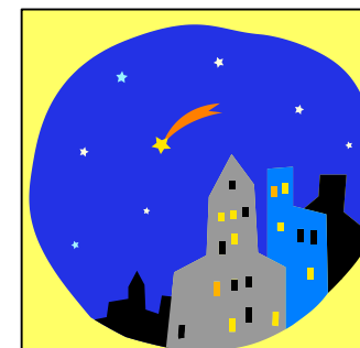
緊急対応と夜間滞在の ダスキン

= > 翌朝 「夕方の依頼で、こんなに早くの対応、ありがとう。昨夜は父の見守りだけでなく、母の 話し相手も明け方3時までしてくれ、買い物・食事やお掃除まで、大変助かりました！」(ご子息)